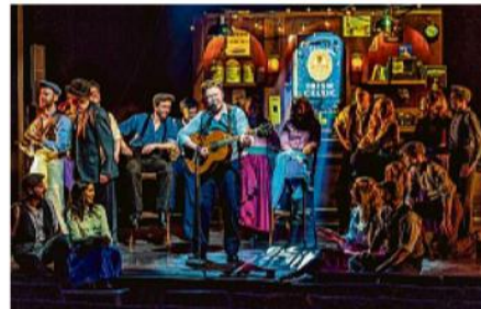
"Irish Celtic" sera à l'Arena ce jeudi.