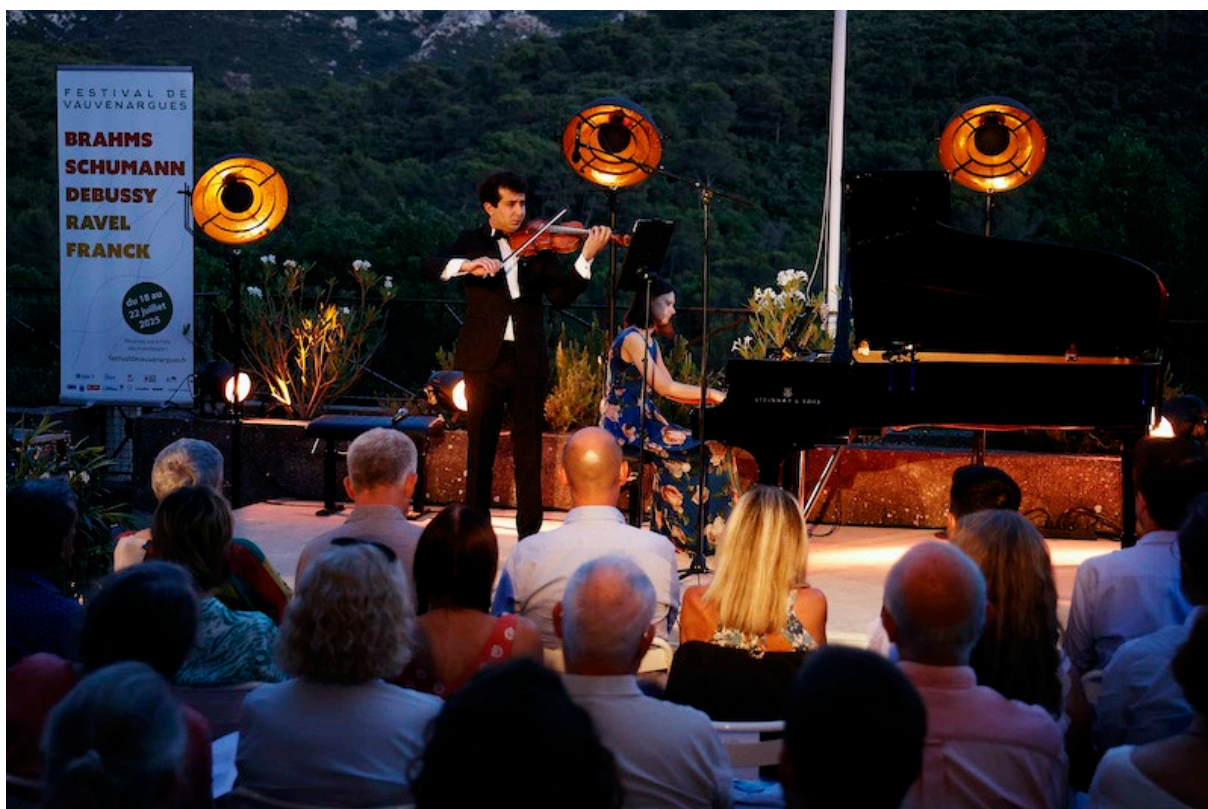
Festival de Vauvenargues 2025

Pour suivre des pages aussi puissamment habitées, il fallait bien la Sonate pour violon et piano n° 2 en sol majeur que Maurice Ravel dédia à une amie violoniste, Hélène Jourdan-Morhange (en raison de rhumatismes, elle ne put créer l'œuvre qui trouva aux côtés de Maurice Ravel himself au piano, George Enesco qui, outre ses talents de compositeur, était un violoniste virtuose). L'existence de l'œuvre pourrait sembler surprenante, Ravel écrivit un jour que le violon lui semblait « essentiellement incompatible » avec le piano !