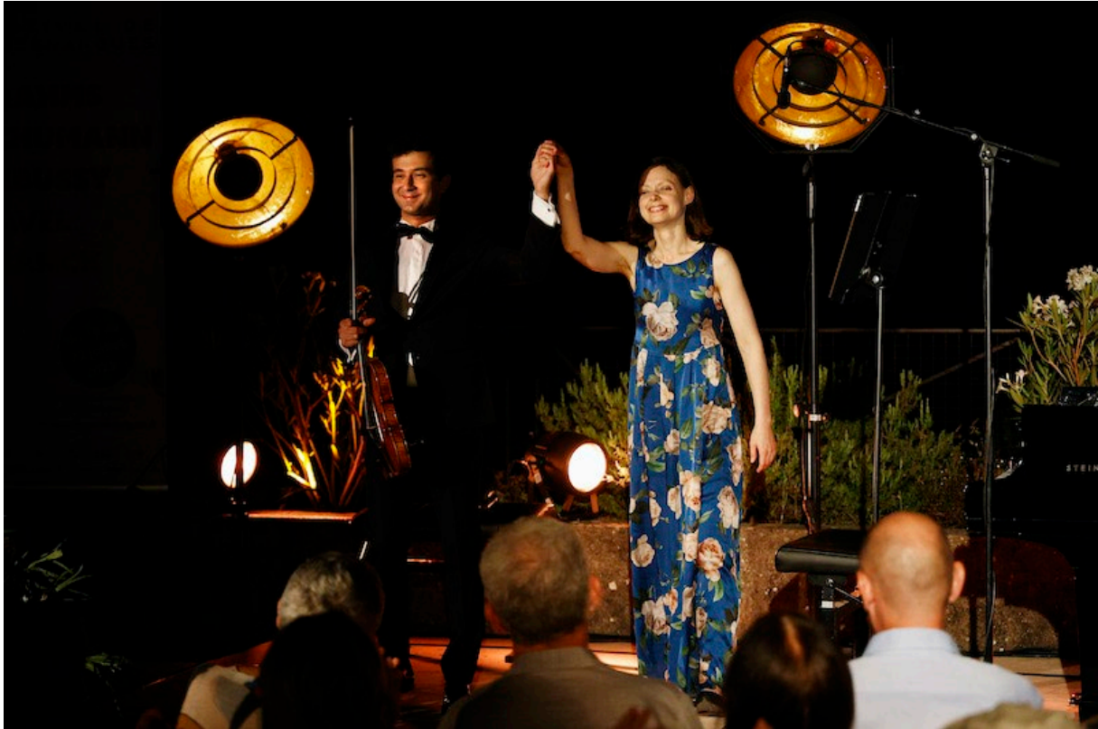
Festival de Vauvenargues 2025

Bon, il y a beaucoup de musiques qui prétendent être celle choisie par le romancier dans cette description, certains affirment même que cette « petite phrase » n'appartient à aucune œuvre connue mais est une création purement littéraire. Peu importe, cette Sonate fut dédiée au violoniste Eugène Ysaÿe et fut capitale dans sa façon de traiter un thème cyclique parcourant toute l'œuvre. La souplesse du début s'emballe, se passionne, s'apaise, atteint une sorte de liberté qui dépasse une certaine inquiétude par une coda brillante, résumant en ses quatre mouvements les quatre mouvements de la vie.