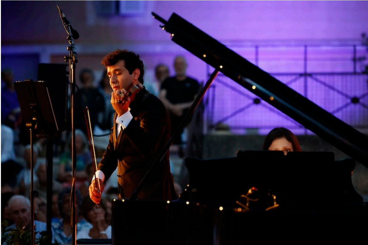
Festival de Vauvenargues 2025

Les Trois romances que l'immense pianiste et compositrice Clara Schumann dédia au violoniste Joseph Joachim, distillèrent leur intense lyrisme, offrant au violon et au piano à travers une apparente simplicité l'occasion de mettre en avant une mélancolie subtile, jonglant entre larges empâtements et délicate légèreté.